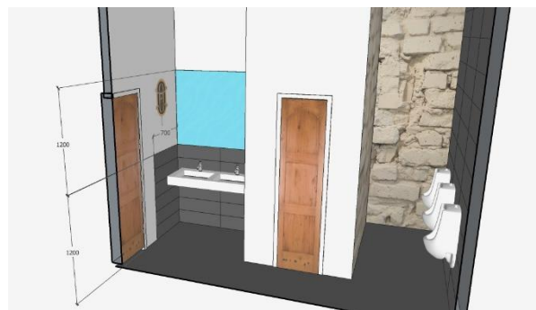
Návrh pánské WC