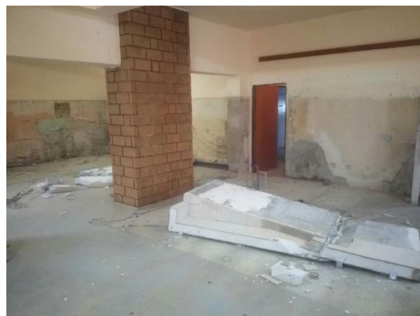
Začátky rekonstrukce – odstranění starého obložení zdí

domu oznámil, že se rozhodl pohostinskou činnost v této hospodě ukončit. A nám se naskytla příležitost dát celému prostoru nový kabát.