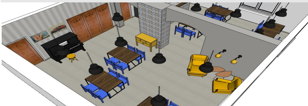
Vizualizace prostoru – návrh Ing. Gabriela Nováková - Gadesign