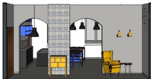
Pohled od sálu ke vstupu do hospody